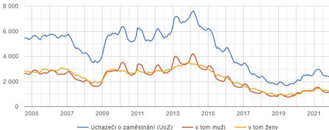
Graf: č. 1 – Časová řada uchazečů o zaměstnání v okrese Trutnov

Z grafu č. 1 lze vysledovat, že počet uchazečů o zaměstnání je pod hranicí 3.000. V posledním období došlo k mírnému nárůstu, který je ovlivněn především pandemickou krizí.