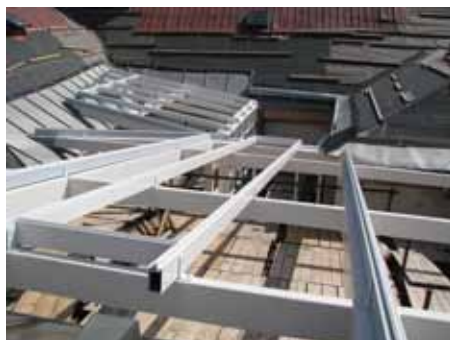
Konstrukce zastřešení atria